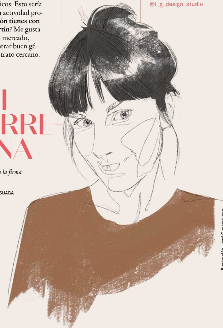
Ilustración: Irati Guarretxena