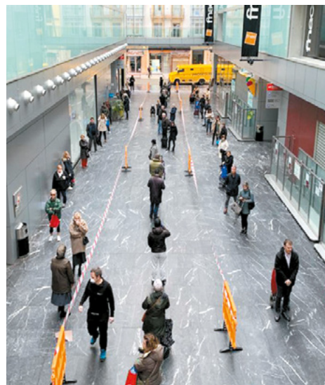
Asegurar el mantenimiento de las distancias de seguridad y el reforzamiento de la higiene han sido esenciales en la gestión de la crisis en San Martín Merkatua. En la imagen, colas organizadas para acceder al mercado durante los primeros días del confinamiento.