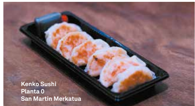
Kenko Sushi Planta 0 San Martín Merkatua