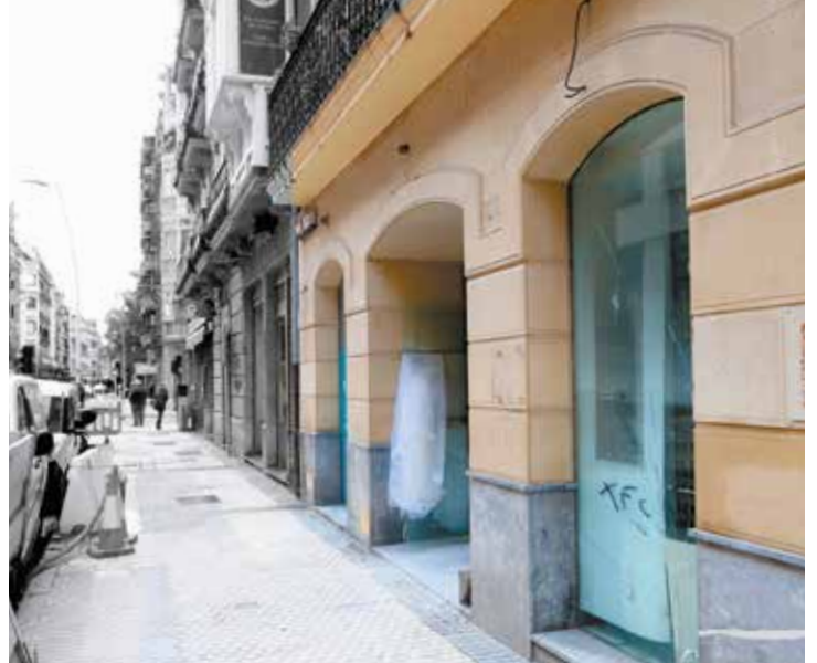
El local de la calle Easo nº 12 se encuentra actualmente en obras.

En la planta a la que se accede desde la calle se instalarán las carnicerías y las charcuterías, las fruterías, el puesto de prensa y la panadería Talo, así como varios puestos de baserritarras. A la planta sótano se trasladarán las pescaderías y el resto de baserritarras.