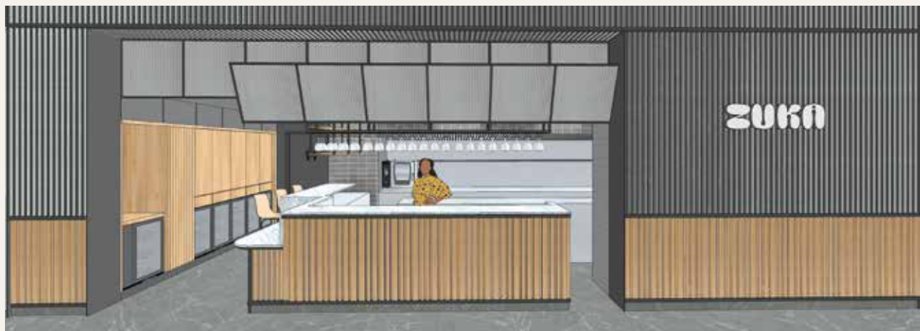
ZUKAk izango duen itxura lanak eta gero.

Beste lokalean marka gipuzkoar bat egongo da, ostalaritza sektorean eskarmentu handia duena eta bertako nahiz garaiko produktuetan oinarritzen den eskaintza gastronomikoa landuko duena, geure filosofiarekin bat egiteko.